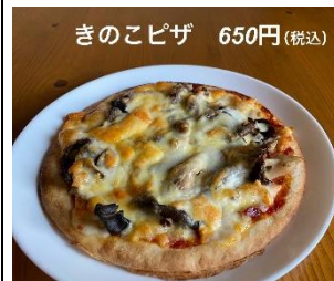
きのこピザ 650円(税込)

◎お客様へ一言 山小屋でしか食べられないメニューをご自宅でご召し上がれます。ドライブスル形式ですので車の乗り降りが必要ありません。利用者に駄菓子又はアイスクリームをサービスします。