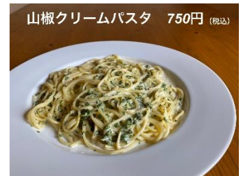
山椒クリームパスタ 750円(税込)