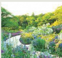
スマイルガーデン ホワイトガーデン 《3月中旬～6月下旬》