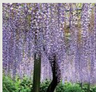
各種フジ 《4月下旬～5月上旬》