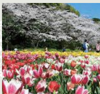
桜とチューリップ 《3月下旬～4月上旬》