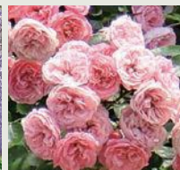
バラ 《5月上旬～6月上旬》