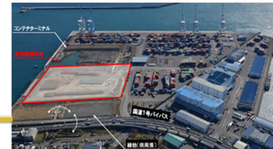
清水港新興津地区 物流拠点整備推進区域（静岡市）