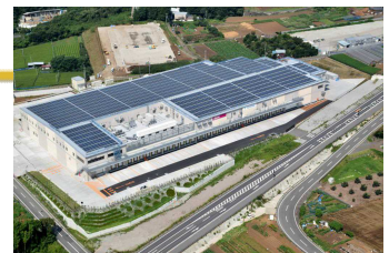
長泉沼津IC周辺 物流関連産業等集積区域（長泉町）