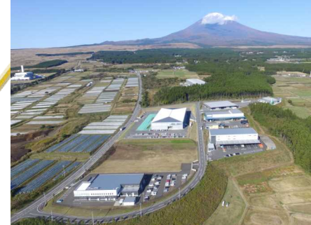
富士山東麓エコガーデンシティ地域循環共生圏 （御殿場市、小山町、裾野市）