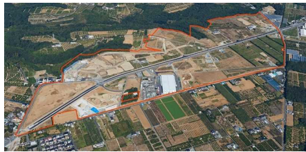
「未来創造『新・ものづくり』特区」 新・産業集積促進区域（浜松市）