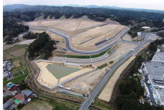
磐田市下野部地区 産業集積区域（磐田市）