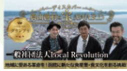
取組紹介のPR動画 (グランプリ地区)