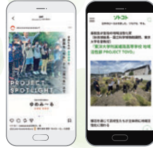
メディア媒体（インスタ、ソトコ）での記事掲載